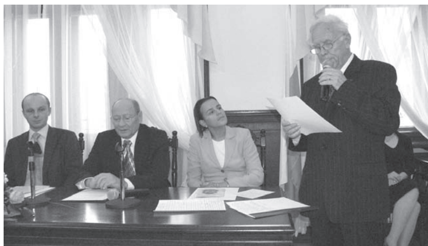
Podczas uroczystości nadania tytułu honorowego obywatela miasta Rzeszowa

W roku 1957 obronił pracę doktorską pt. „Konstrukcje sprężone kołowo-symetryczne”, a w roku 1969 uzyskał stopień naukowy doktora habilitowanego za pracę pt. „Sploty jako zbrojenie sprężające w konstrukcjach strunobetonowych”. Z pracą dydaktyczną łączył pracę projektową w Biurze Studiów i Projektów Typowych Budownictwa Przemysłowe-