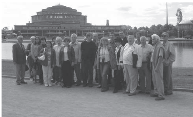
Wycieczka Oddziału PZITB do Wrocławia – 30.08 – 01.09.2007 r.